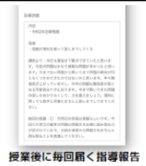
授業後に毎回届く指導報告

塾での学習内容、また宿題が完成しているか、小テストの点数はとれているか、こういった情報は、保護者さまのスマホアプリにすべてお届けします。また、アプリ内のチャットを使い、「ちょっと気になること」などをお気軽にご相談いただけます。年3回の保護者懇談、年3回の保護者会で、ご家庭と連携をとってお子さまを成長に導きます。