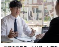
生徒面談をきっかけに、とてもやる気になったというお声も。

思春期の子どもたちは、お家の人には言えなくても第三者の大人にならば言えることもあります。お子さまは今、何を目標とし、何に悩んでいるか、どう考えているかを1:1でお話する、「生徒面談」をご用意しています。それを保護者さまにフィードバックすることで、お子さまにとって本当に必要なことをご提案差し上げることができます。