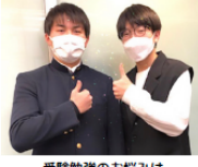
受験勉強のお悩みは、緑風自慢の講師にご相談ください！

高校部の授業では、勉強を教えることはもちろん、志望校の数値目標を確認し、何をいつまでに・どれだけ学習するかを毎回一人ひとりのお子さまと確認し、迷いなく勉強が進められるようにします。お子さまが力を最大限に発揮できるよう、一人ひとりの性格と特性を踏まえた戦略を話し合います。下記は昨年度入試結果の一部です。