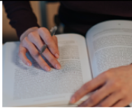
お子さまの宿題ノートは毎回講師がチェックします

成績を上げるためには、塾での授業はもちろん、お家ででの学習を含めたトータルサポートが必要です。緑風塾ではお子さまが迷いなく学習を進め、自然と実力がつくように宿題→定着テストのサイクルを徹底します。「教えるだけ」ではなく、自らが考えて解けるように、勉強の仕方を教え、お子さまに実力がつく「学習習慣」をつけます。